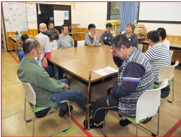
『みんなの時間』楽しいお話や 防災カルタでの勉強

ですから、この『みんなの時間』は大いにお喋りをして貰おうという趣旨なのです。はじめは何を話してよいか判らなくても、回を重ねるうちに皆さんが少しずつお話をされるようになって来ました。