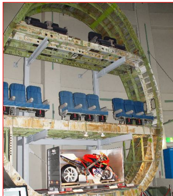
ジャンボ機の胴体部分の輪切り (本物) 大きい!!