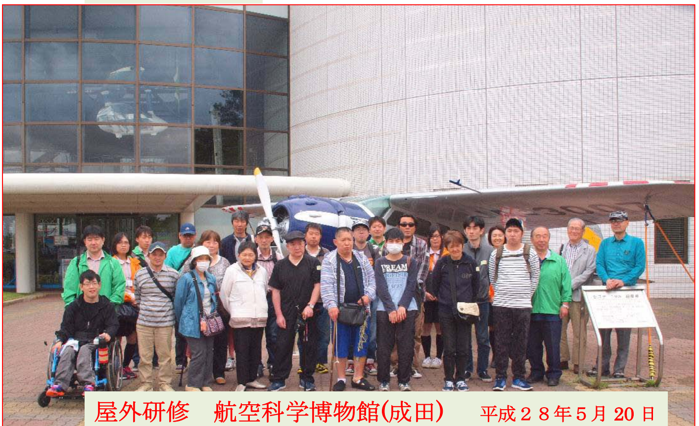
屋外研修 航空科学博物館(成田) 平成28年5月20日