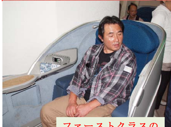
ファーストクラスの座り心地は如何？