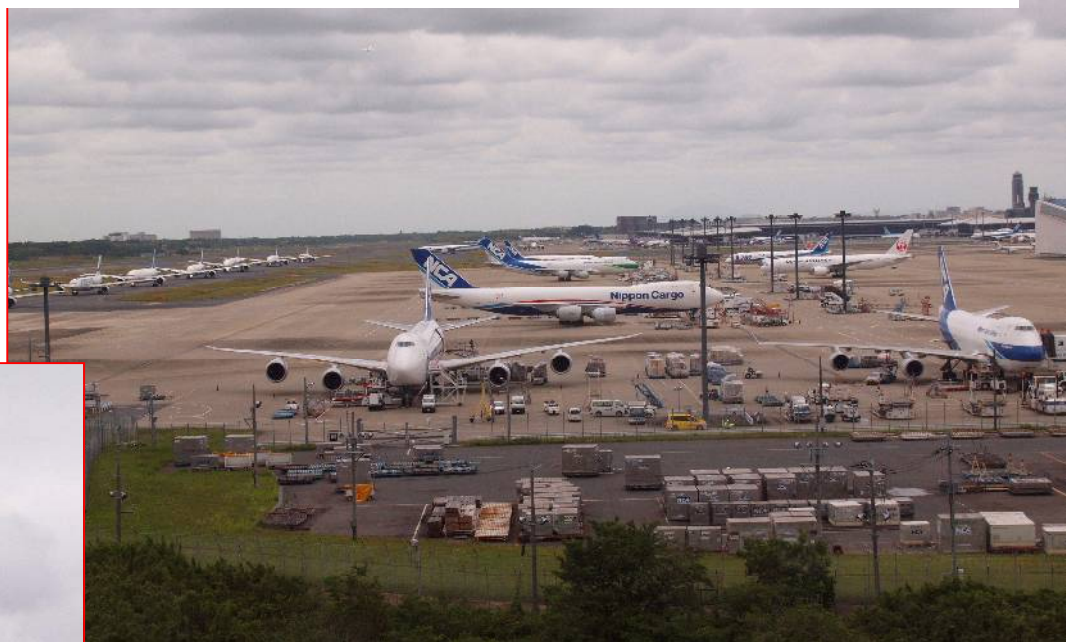
展望フロアから 左側に並んでいる飛行機が順番に離陸して行きました