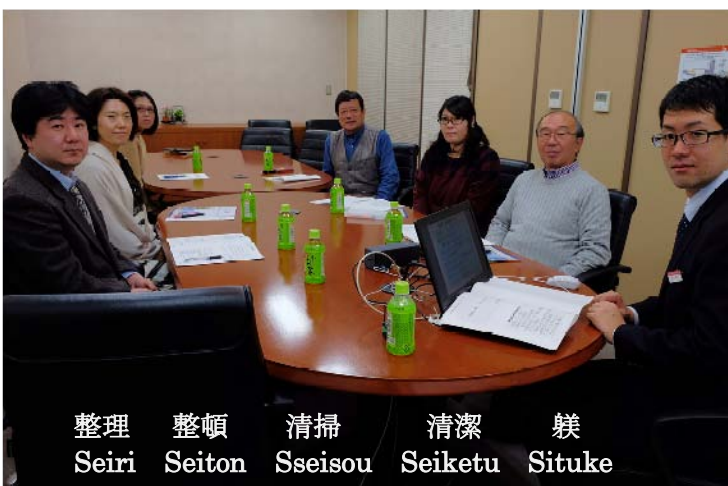
整理 Seiri 整頓 Seiton 清掃 Sseisou 清潔 Seiketu 躰 Situke